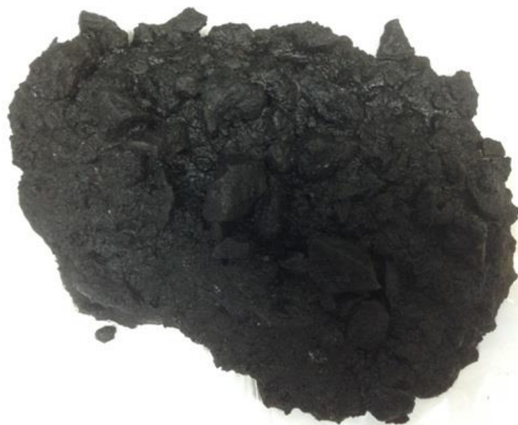
Рисунок А.2 – Смесь с битумной эмульсией пригодной для приготовления органоминеральных смесей по показателю обволакиваемости

Оценку совместимости битумной эмульсии и минерального материала органоминеральной смеси по показателю сцепления выполняют с помощью пробы, прошедшей испытания на обволакиваемость.