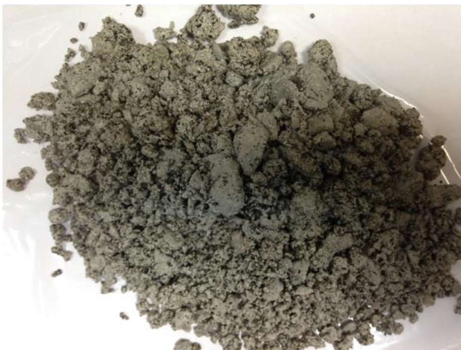
Рисунок А.1 – Смесь с битумной эмульсией не пригодной для приготовления органоминеральных смесей по показателю обволакиваемости

На рисунке А.1 показан образец смеси с битумной эмульсией, не пригодной для приготовления органоминеральных смесей по показателю обволакиваемости, на рисунке А.2 – с пригодной.